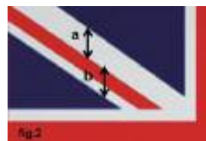
fig.2 Linksboven quadrant van de Union Flag: a ligt boven b.