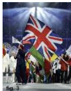
fig.3 Intocht in Sochi: Union Flag op correcte wijze aan vlaggestok.